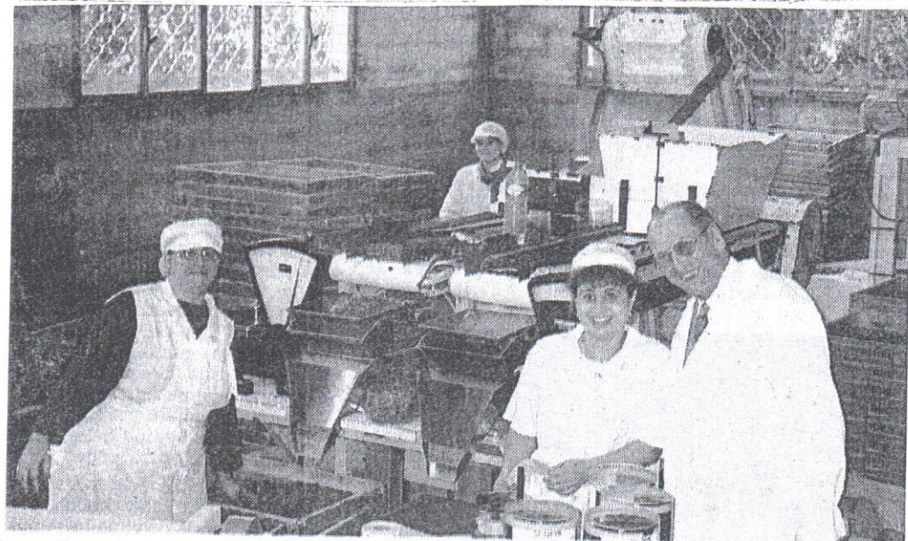
Vérification de la qualité à la sortie de la chaîne de fabrication des réglisses, avant la mise en sachet.